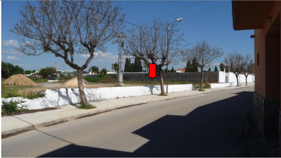
Vista desde la N-340