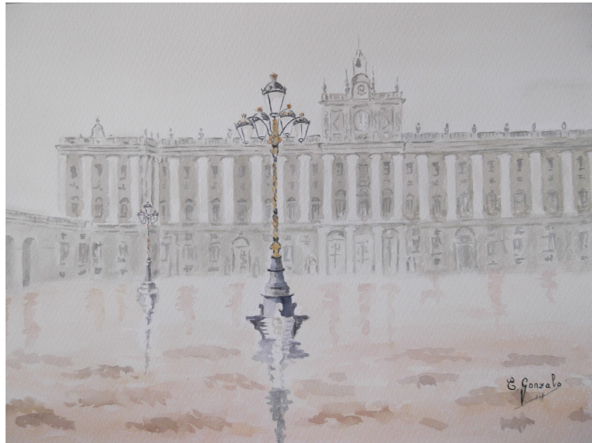
ELISA GONZALO TEJEDOR "Llueve en Palacio"