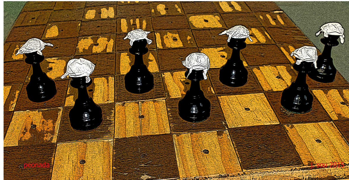
JOSEP SOU "Peonada"