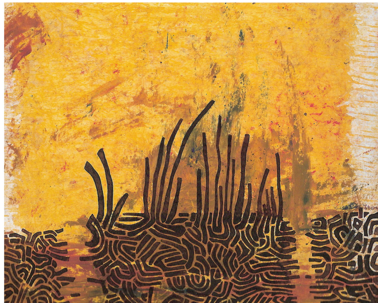
IBIRICO "Pintura CXXXVI"