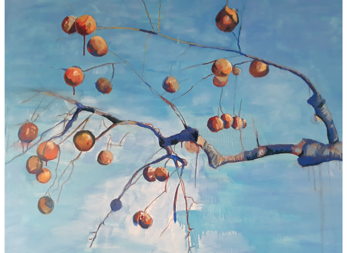
Caqui · Oli sobre llenç · 64'5 x 81 cm