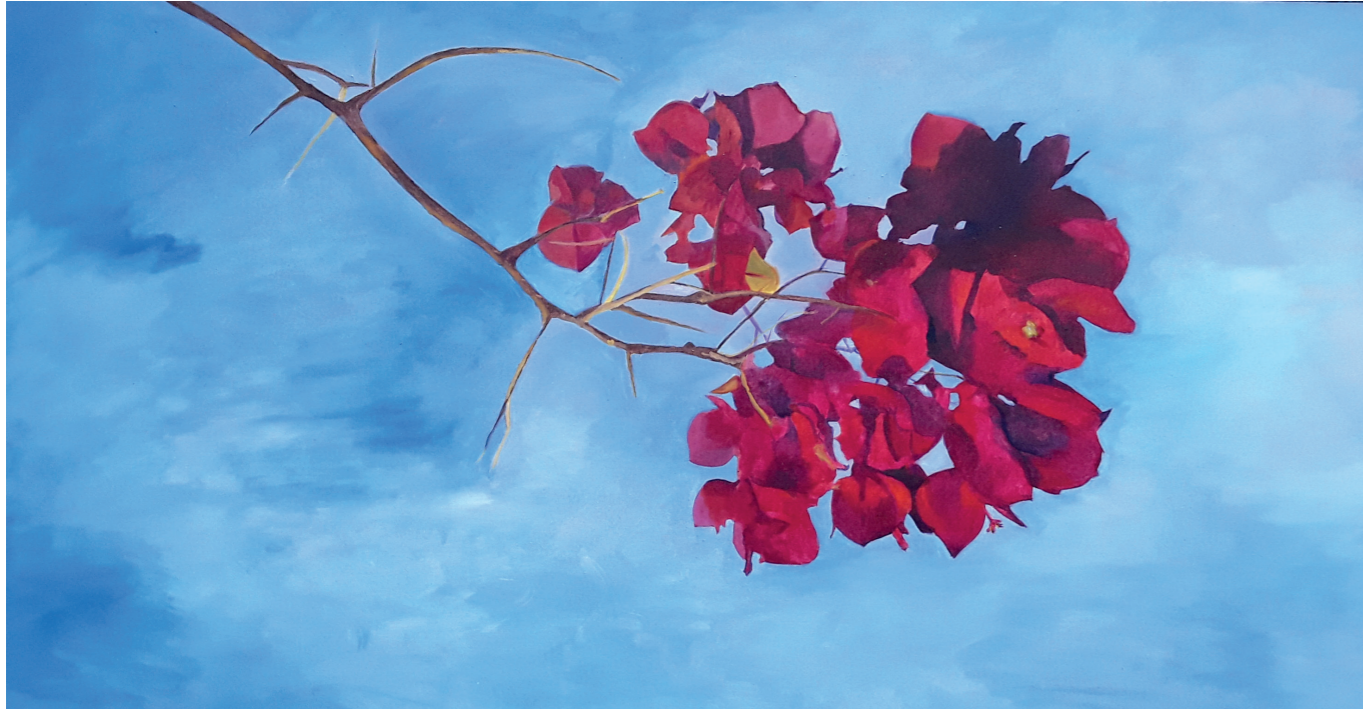
Bougambilia · Oli sobre llenç