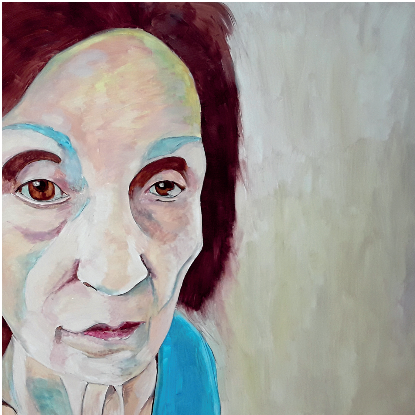
Memoria / olvido 2 · Oli sobre llenç · 100 x 100 cm