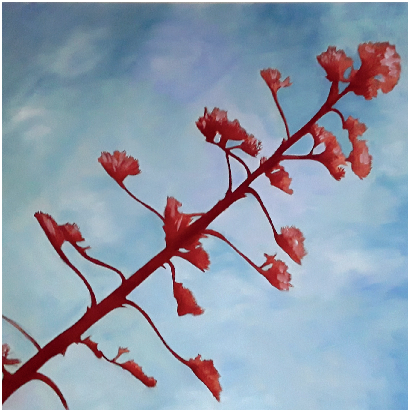
Atzavara · Oli sobre llenç · 100 x 100 cm