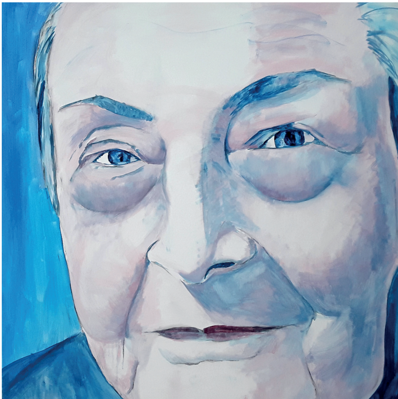
Marina – Albufera · Oli sobre llenç · 100 x 100 cm