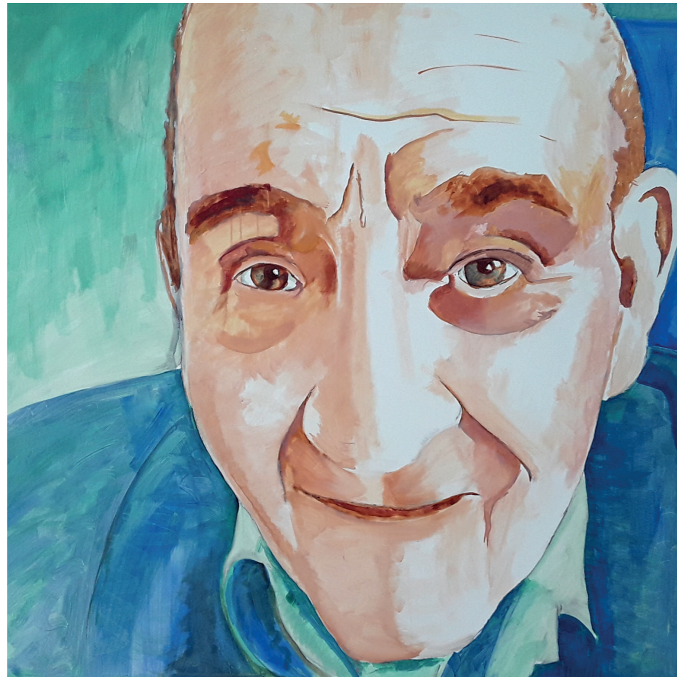
Memoria / olvido 3 · Oli sobre llenç · 100 x 100 cm