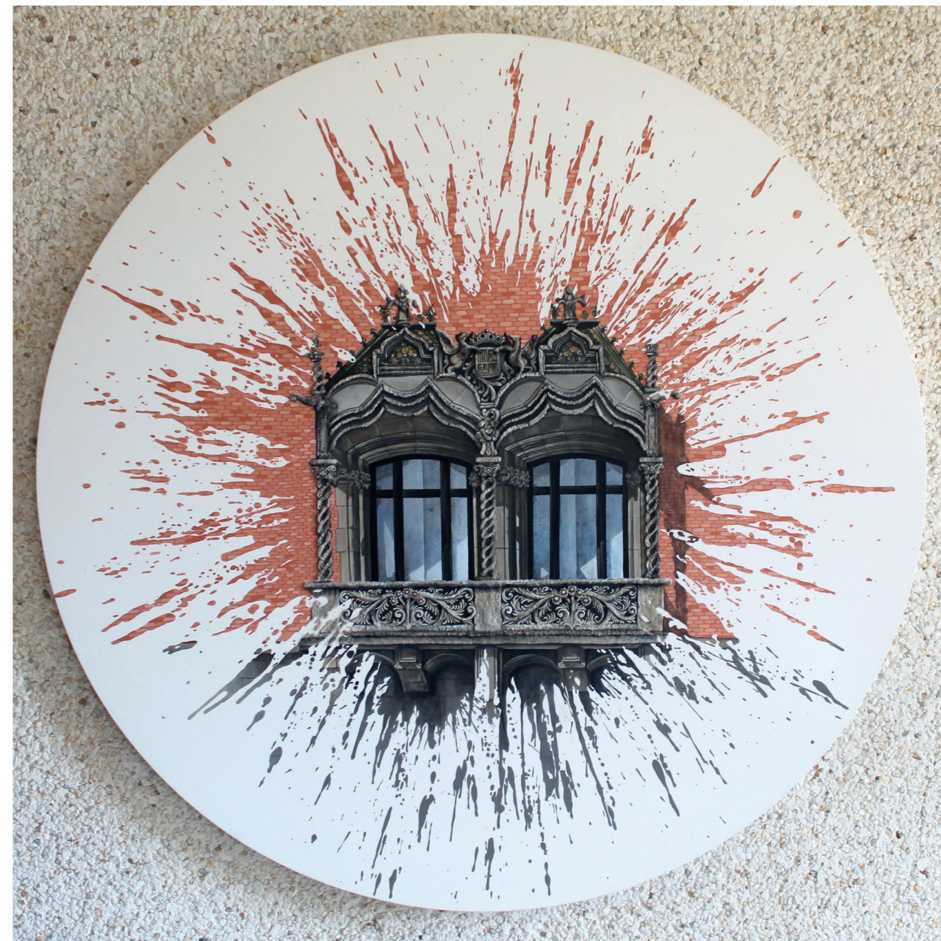
Esquitxant Granollers · Tècnica mixta sobre tela · 1 m de diàmetre