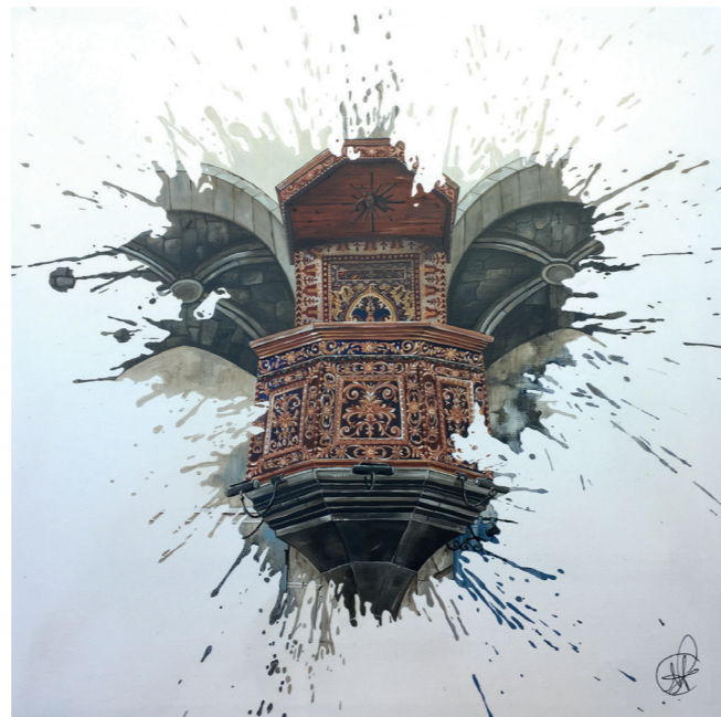
Detall de l'Església de Sant Pere de l'Escala · Acrílic sobre tela 40 x 40 cm