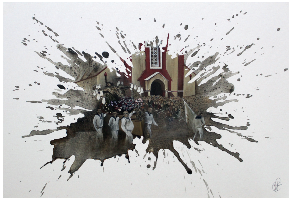
Santíssim Crist de la Mar Acrílic sobre tela · 50 x 70 cm