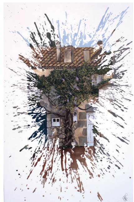
Sant Martí d'Empúries · Acrílic sobre tela · 100 x 60 cm