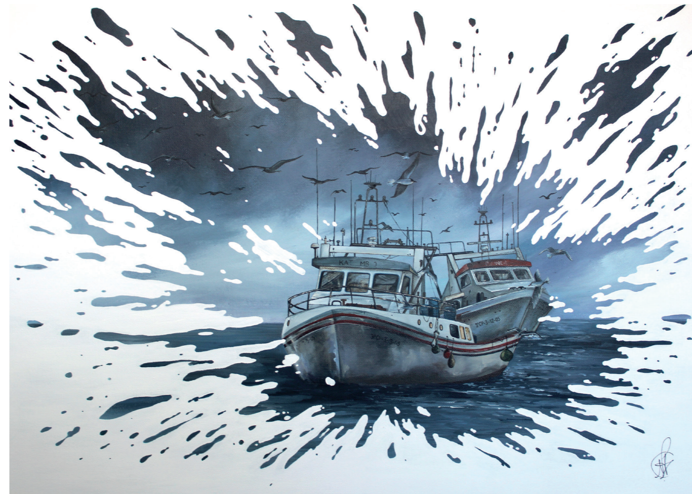
Tornem a Port · Acrílic sobre tela · 50 x 70 cm