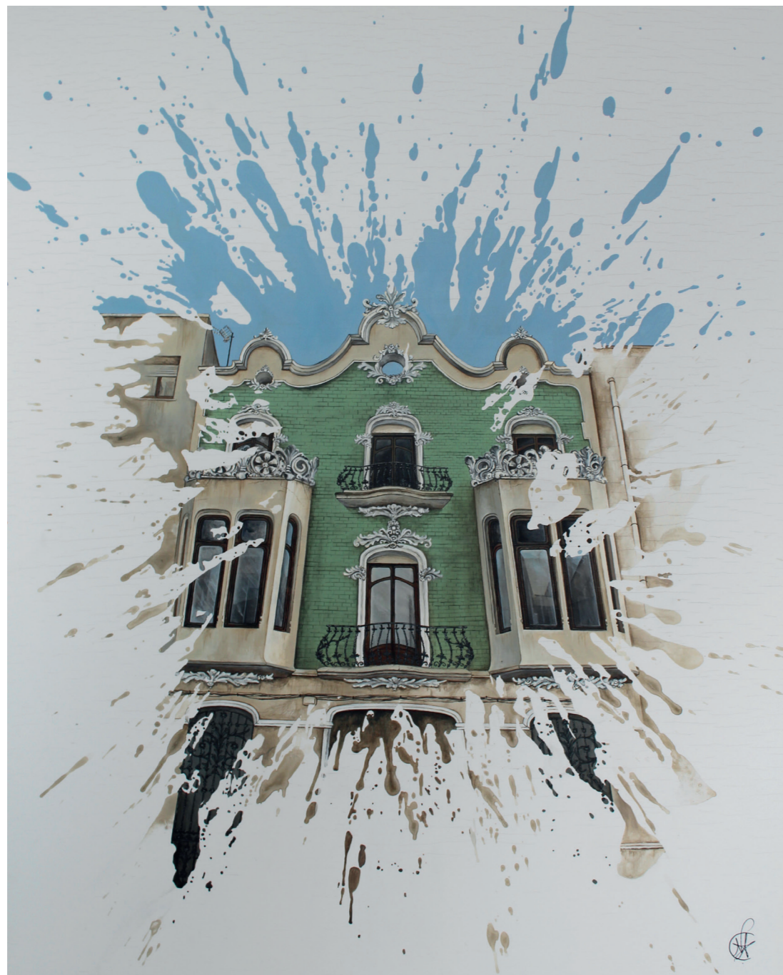
Casa Bosch · Acrílic sobre fusta · 81 x 65 cm