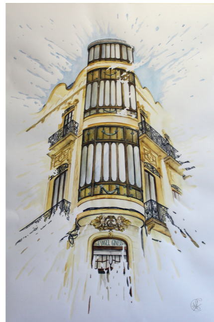
Casa de Ángel Giner · Aquarel·la sobre paper · 100 x 70 cm