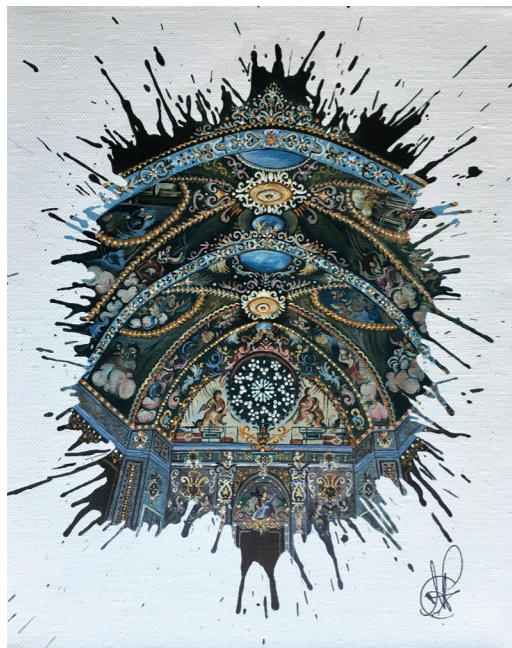
Capella de Sant Nicolau · Acrílic sobre tela · 45 x 25 cm