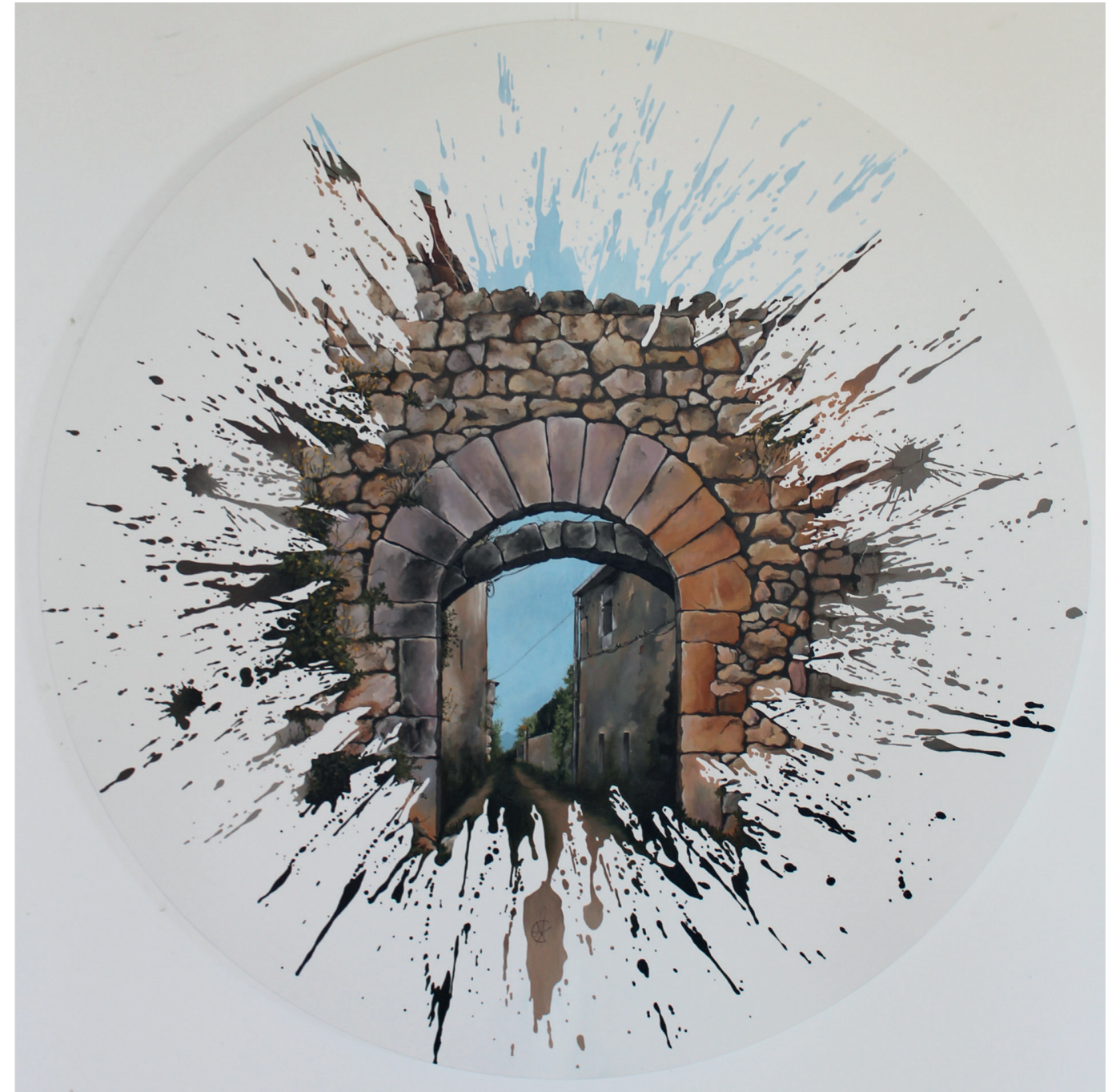
Cinc Claus · Acrílic sobre tela · 1 m de diàmetre