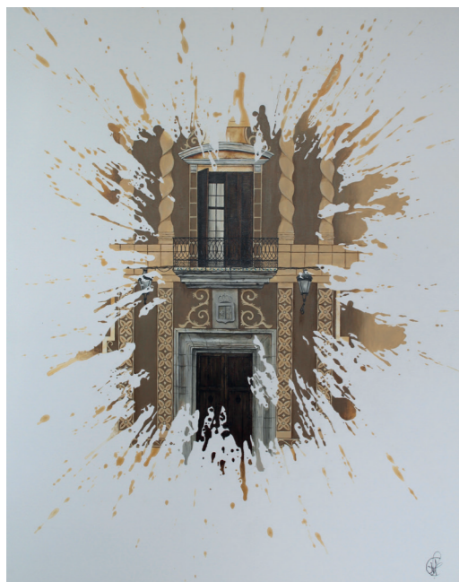
Ajuntament de Benicarló · Acrílic sobre fusta · 81 x 65 cm