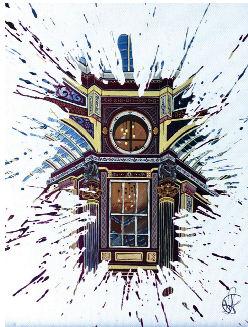
London · Acrílic sobre tela · 45 x 25 cm