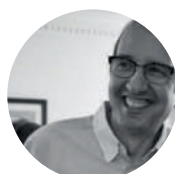
Antoni Bassas comunicador