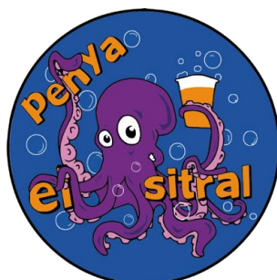
PENYA EL SITRAL