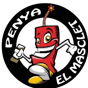
PENYA EL MASCLET