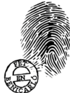
PENYA SECTOR CRÍTIC