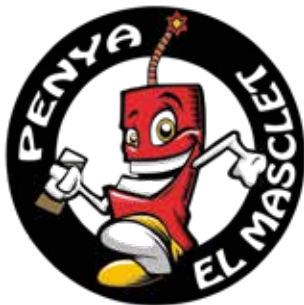
PENYA EL MASCLET