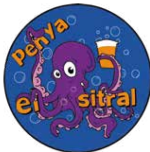
PENYA EL SITRAL