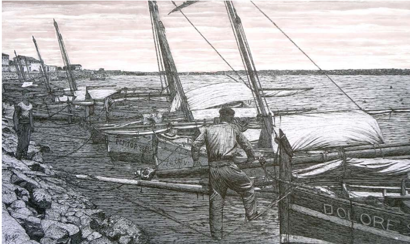
A la mar. La xerradeta abans de la feina.

Era costumbre, perdida ahora en un mundo de prisas, entablar conversación parsimoniosa y tranquila antes de emprender los quehaceres cotidianos. El tajo. Armonía, sencillez y paz en homenaje al trabajo sacrificado y silencioso de nuestras gentes para proveer de alimento a sus familias.