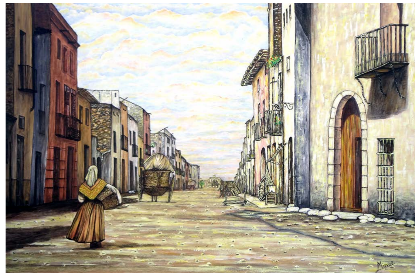
(A la meua mare) Dona benicarlanda pel Camí d'Alcalà, 1918.

Los niños y las niñas en edad escolar caminan hacia lo que ahora conocemos como el MUCBE que antaño fuera, desde 1843 a 1919, escuela, hospital, convento e incluso, de joven, lo conocí como cine y cuartel de la Guardia Civil. A la derecha, al fondo, vemos a dos jóvenes que cortejan a una jovencita. El del medio, con aires de señorito, quiere conquistarla ante la duda de su compañero que, rascándose la cabeza, no ve nada clara la conquista.