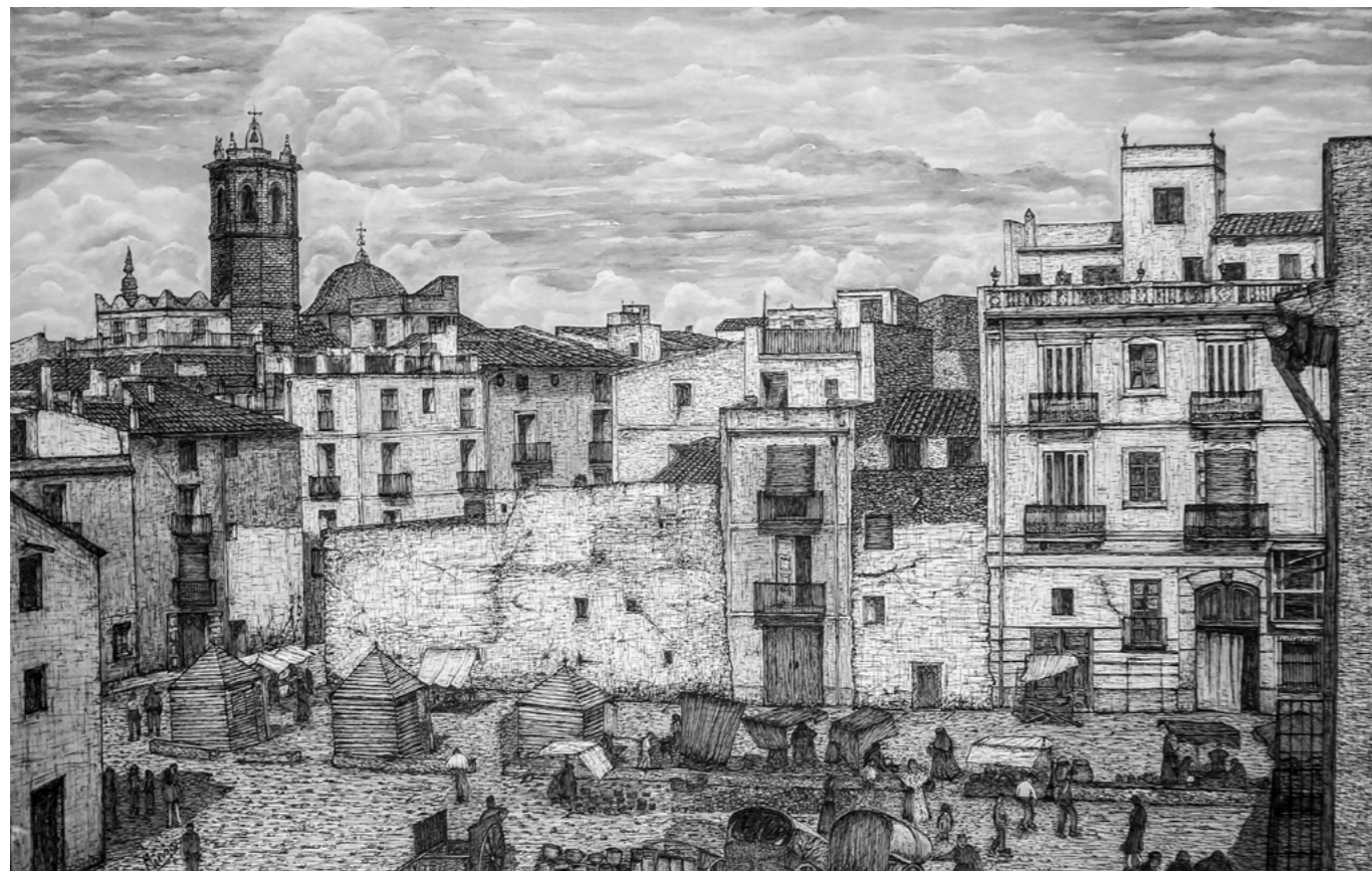
Les paradetes del mercat, 1905.

Casitas de madera para guarecer los enseres y la mercancía del sol y de la lluvia. A la derecha un edificio de los pocos que todavía se conservan en la actualidad, con la puerta de madera noble trabajada artesanalmente abrigada por un marco de piedra labrada con la inscripción de la fecha de 1891. Según cuentan, en esta plaza que da entrada a la calle del Mar había un trinquete.