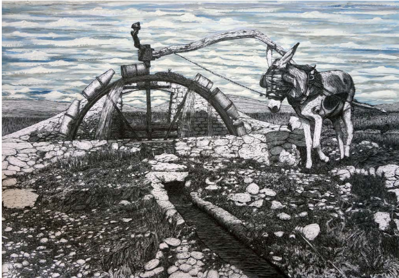
A la terra. Regant en cadufs i fent calceta, 1900.

Este tipo de riego de fundición empezó a utilizarse en nuestros campos allá por el año 1900. Mientras el burro saca el agua del pozo dando vueltas a la noria la mujer, sentada en la acequia, aprovecha el tiempo tejiendo prendas de vestir para la familia, mientras espera que el líquido llegue al final del surco. Se dice que en 1564 la huerta benicarlanda contaba con más de 400 "norias".