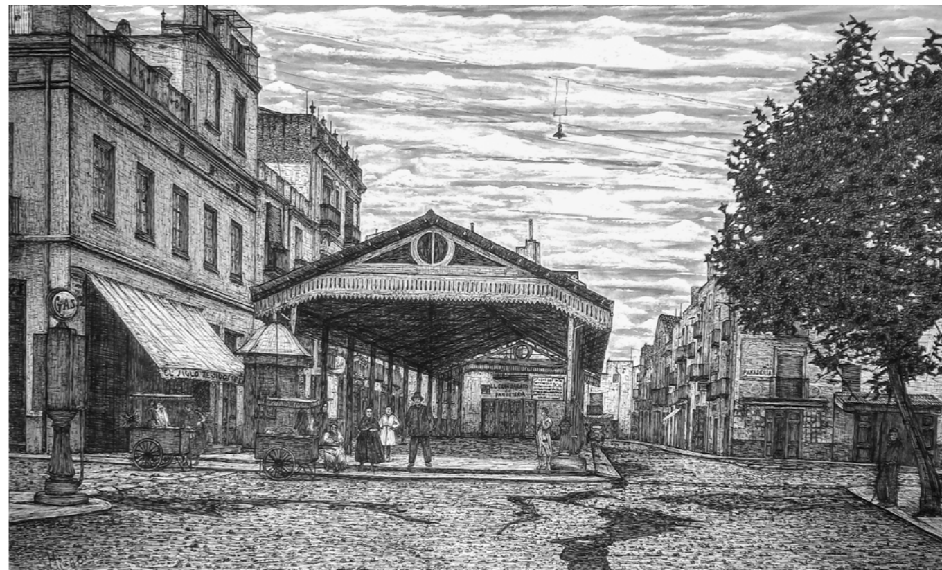
El quiosc i els carrets dels gelats a la Plaça "Don Manuel Palau Esteban", 1936.

Casitas de madera para guarecer los enseres y la mercancía del sol y de la lluvia. A la derecha un edificio de los pocos que todavía se conservan en la actualidad, con la puerta de madera noble trabajada artesanalmente abrigada por un marco de piedra labrada con la inscripción de la fecha de 1891. Según cuentan, en esta plaza que da entrada a la calle del Mar había un trinquete.