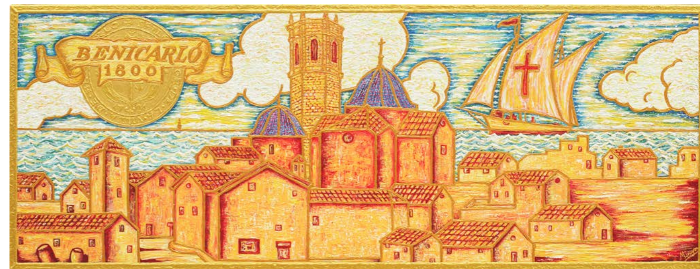
Este proyecto estaba previsto presentarlo en 2.020, pero debido a la pandemia se tuvo que posponer. De dicha situación salieron estas obras tan impresionantes (de una zona oscura siempre sale un rayo de luz).