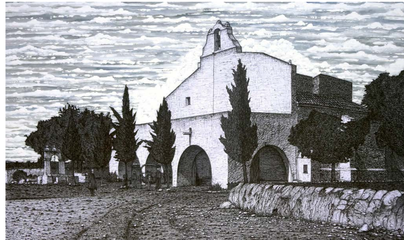
Ermita de Sant Gregori, 1915 (data de 1716).

He pintado el actual MUCBE, el Convent de Sant Francesc, en un tiempo invernal, de una imagen que apenas podía distinguir las líneas ni la composición por el deterioro de la fotografía. El año 1963 nevó. Tenía entonces ocho años y nos pusimos a hacer muñecos de nieve mientras los padres quitaban la nieve de los tejados, en los cuales criábamos conejos y gallinas para nuestro sustento.