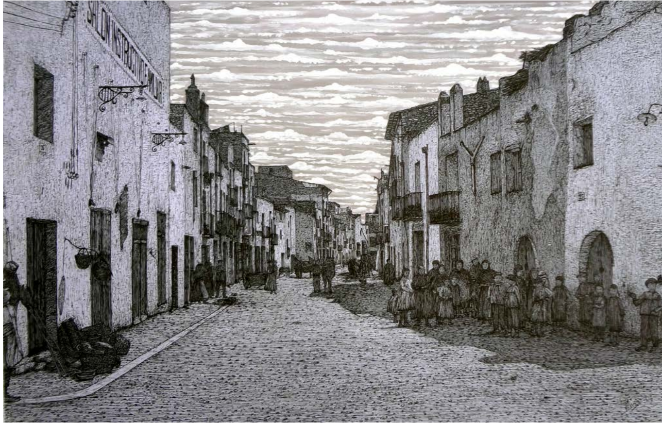
Carrers d'Olivella i "Rey Don Jaime", 1915 (On vaig nèixer el 1954).

Calle del Rey Don Jaime, nº 8 en la que nací. Se aprecia en la fachada de la izquierda el rótulo con el texto "Salón familiar", y es que se trataba de un centro para las reuniones familiares, las celebraciones, y los eventos culturales y sociales de la época, que más bien debían ser pocos.