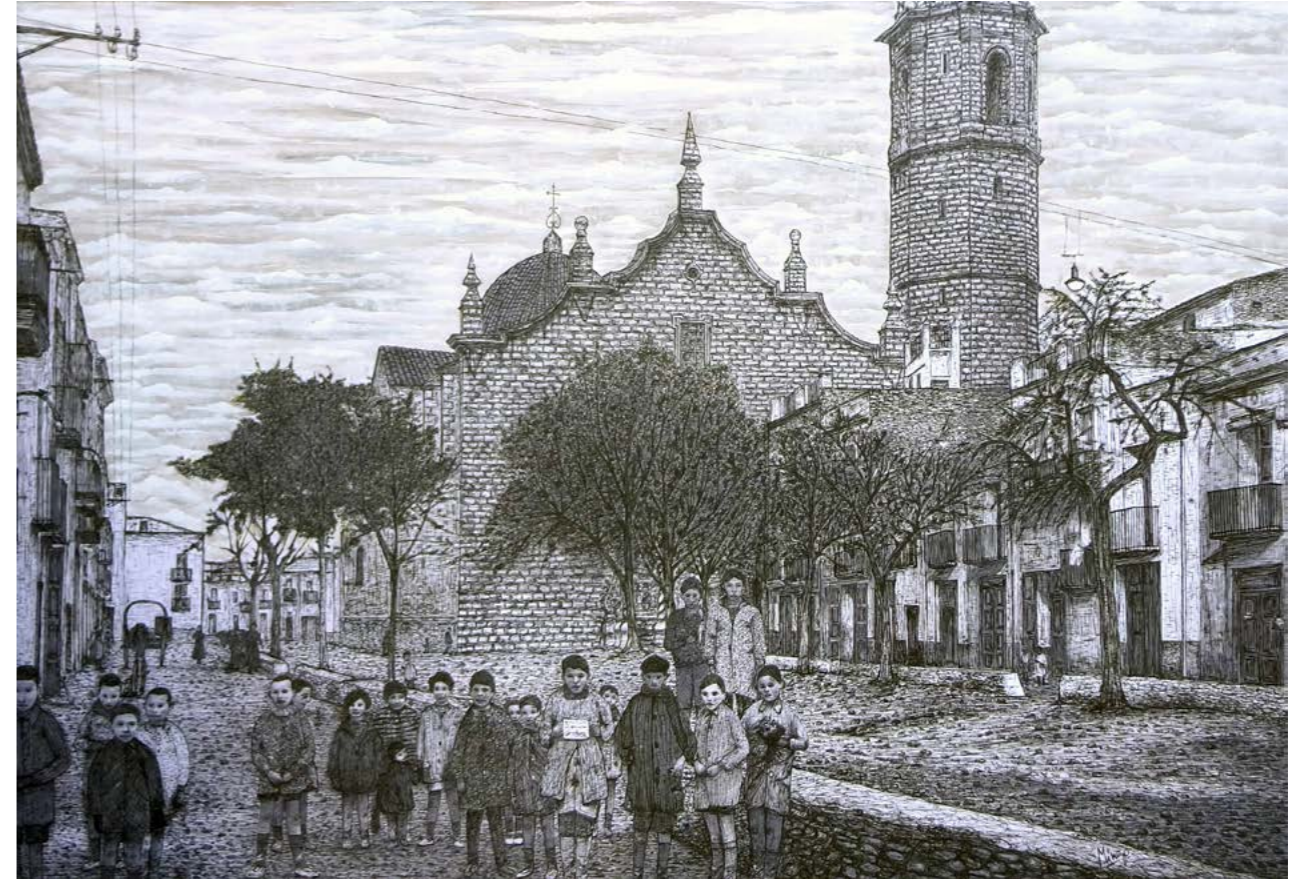
Els pares de la meua generació al carrer Joaquin Ferreres, 1930.

Calle del Rey Don Jaime, nº 8 en la que nací. Se aprecia en la fachada de la izquierda el rótulo con el texto "Salón familiar", y es que se trataba de un centro para las reuniones familiares, las celebraciones, y los eventos culturales y sociales de la época, que más bien debían ser pocos.