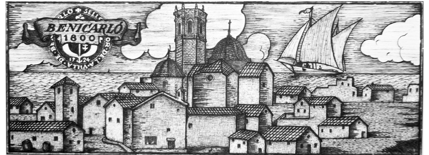
Al meu poble, Benicarló: La identitat d'un poble.

Grabado de la época que he querido enriquecer y personalizar añadiendo a la imagen el sello de la villa de 1724, como homenaje “Al meu poble”. Comentar, como dato significativo que, en Mi Historia pintada de Peñíscola, y también en la de Castellón he personalizado unos grabados. El siglo XVIII i XIX fue la época dorada de los viñedos del Maestrat. El vino Carlón fue uno de los más exportados de España, y adquirieron fama en los cinco continentes.