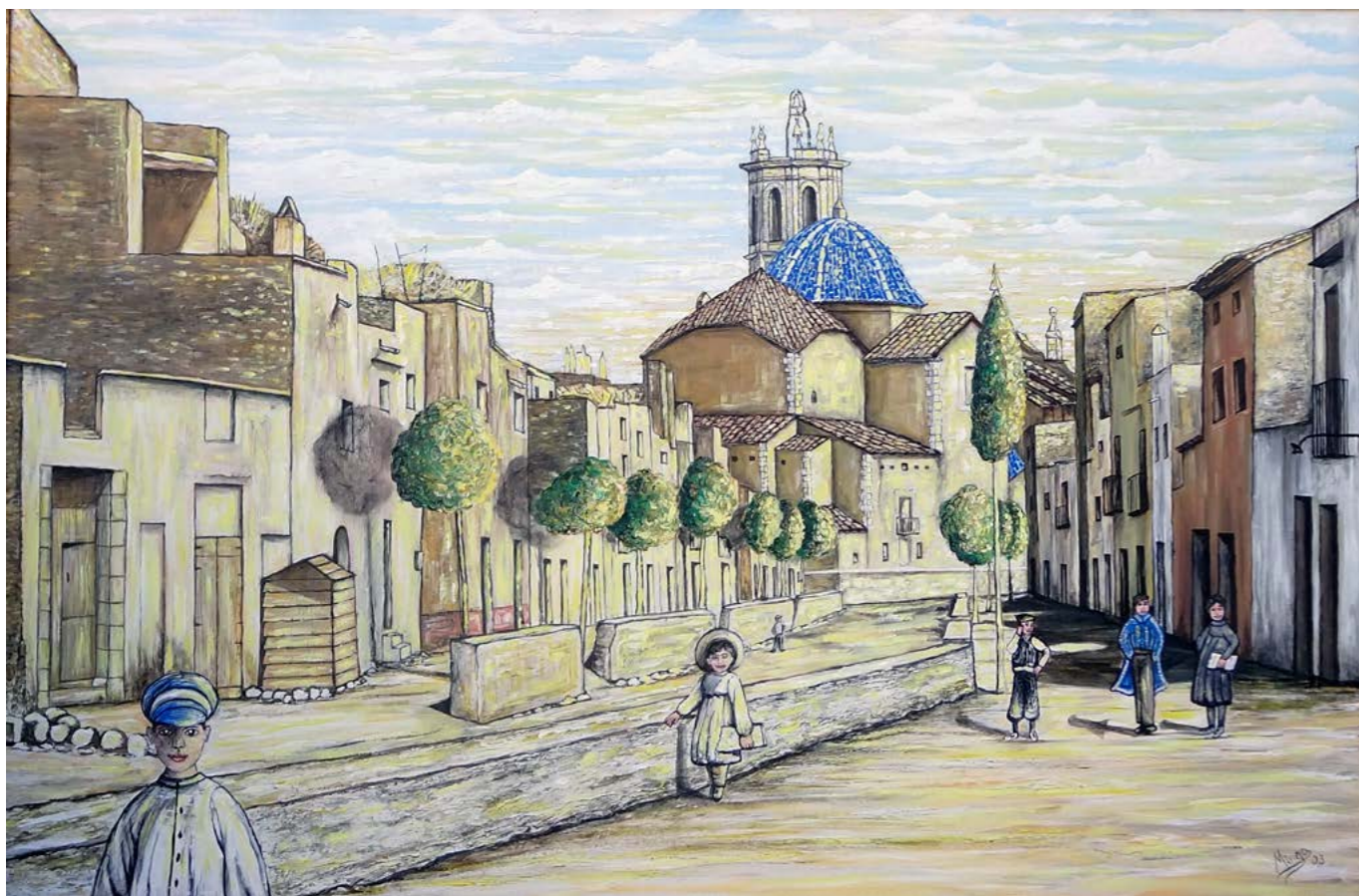
(Al meu pare) Caminant cap a l'escola del Convent, 1905.

Los niños y las niñas en edad escolar caminan hacia lo que ahora conocemos como el MUCBE que antaño fuera, desde 1843 a 1919, escuela, hospital, convento e incluso, de joven, lo conocí como cine y cuartel de la Guardia Civil. A la derecha, al fondo, vemos a dos jóvenes que cortejan a una jovencita. El del medio, con aires de señorito, quiere conquistarla ante la duda de su compañero que, rascándose la cabeza, no ve nada clara la conquista.