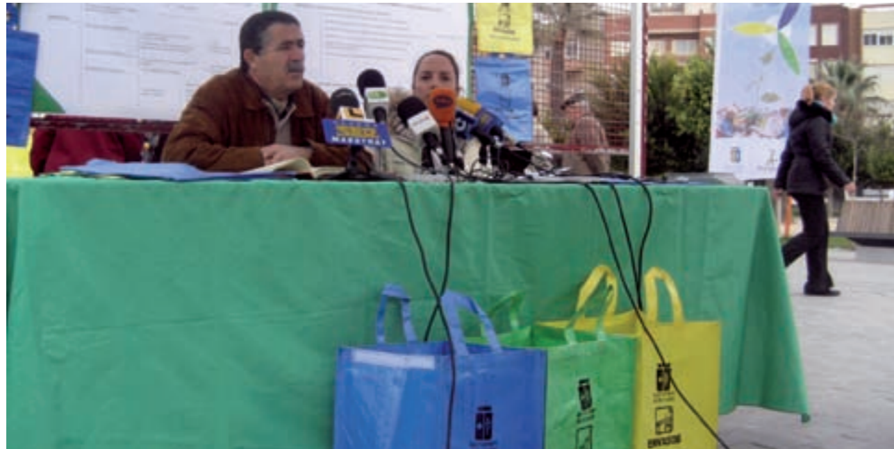
Imatge de la presentació als mitjans de la campanya

La Regidoria de Medi Ambient de l'Ajuntament de Benicarló acaba de tancar amb un important èxit de participació una campanya de comunicació a la ciutadania per promoure el reciclatge dels residus domèstics.