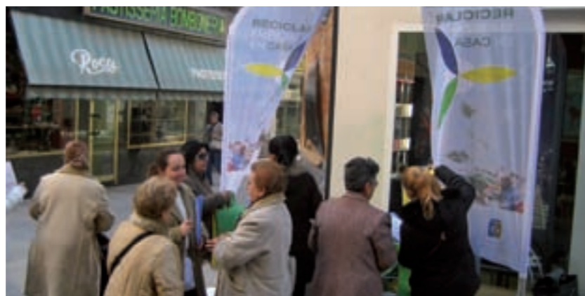
Els ciutadans de Benicarló han respost molt positivament a la campanya

La campanya ha tingut una duració de dos setmanes i durant aquest temps els punts d'infor-