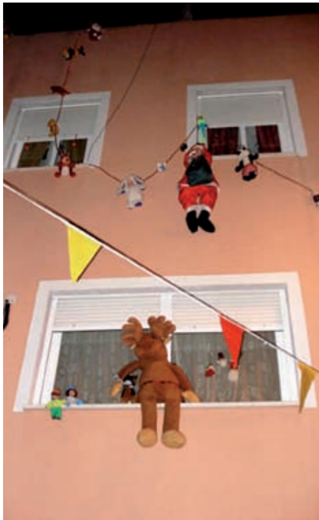
Una de les façanes que es va presentar l'any passat