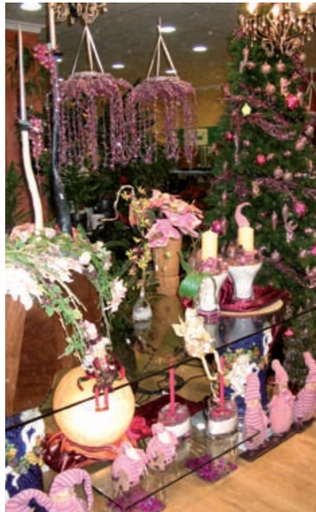
L'aparador que va guanyar l'any passat va ser el de la Floristeria La Orquídea

Amb motiu de l'arribada de les Festes de Nadal i Reis, la Regidoria de Festes convoca un concurs d'engalanament de façanes on podrà participar qualsevol façana feta o en construcció de Benicarló, excepte els aparadors comercials. La temàtica és absolutament lliure i es repartiran fins a 500 euros per al guanyador, 300 euros per al segon premi i 200 euros per al