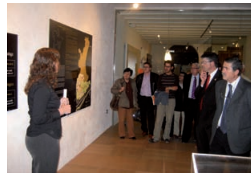
A l'acte van acudir les principals autoritats de Benicarló

L'exposició compta amb un servei de visites guiades completament gratuïtes durant els caps de setmana. També hi haurà visites guiades i tallers didàctics per a tots els centres educatius de Benicarló.