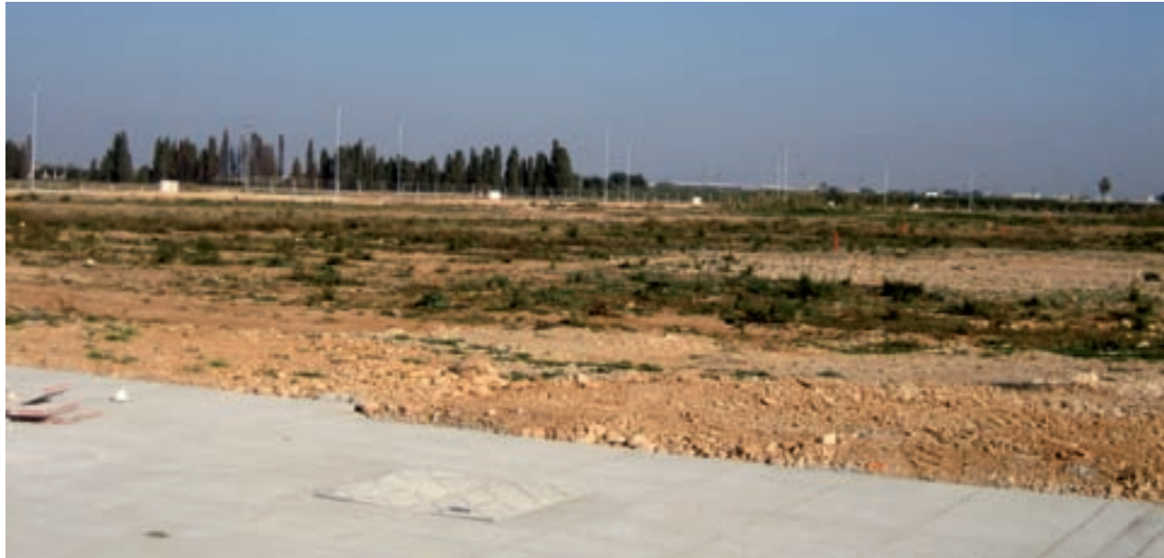
Els primers habitatges protegits promoguts per l'Ajuntament es construiran a Ciutat Sénior

La Regidoria d'Urbanisme ha aprovat l'Ordenança reguladora del Registre de Demandants d'Habitatges Protegits per tal de facilitar l'accés a l'habitatge a Benicarló. L'Ajuntament utilitzarà les dades d'aquest Registre per obtenir informació sobre la demanda d'habitatge i poder oferir així una oferta ajustada a les necessitats de les persones interessades a optar a un habitatge protegit