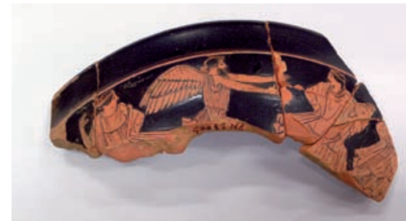
L'exposició inclou les restes arqueològiques més rellevants que s'han trobat als jaciments de Benicarló, com la cilix i el tresoret