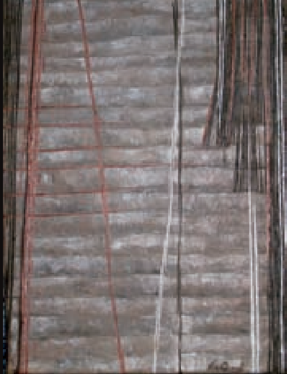
Sense aire | sin aire