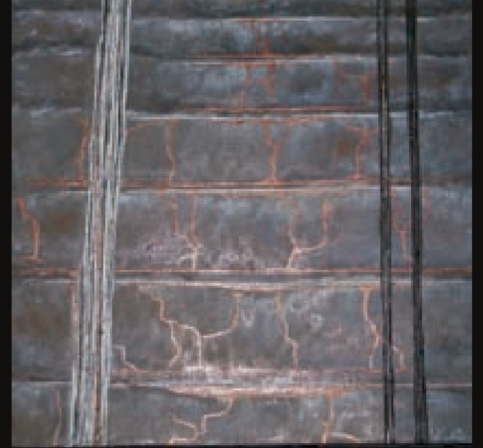
Pas a pas | Paso a paso