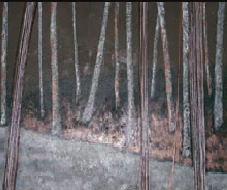
Sense aigua fresca | Sin aigua fresca