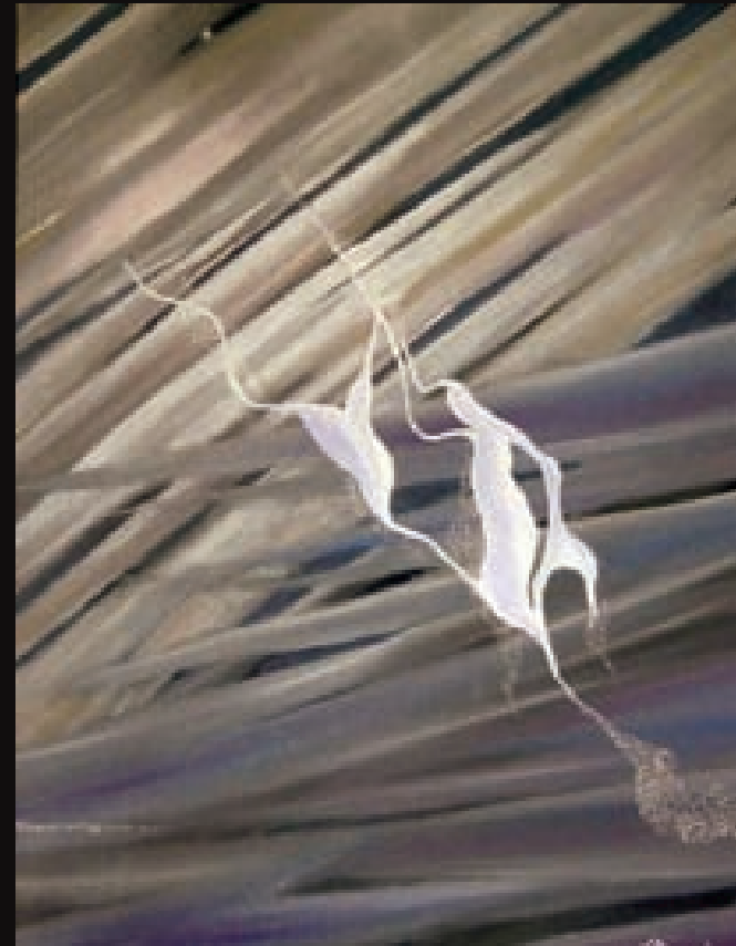
Pedra de Luna | Piedra de Luna