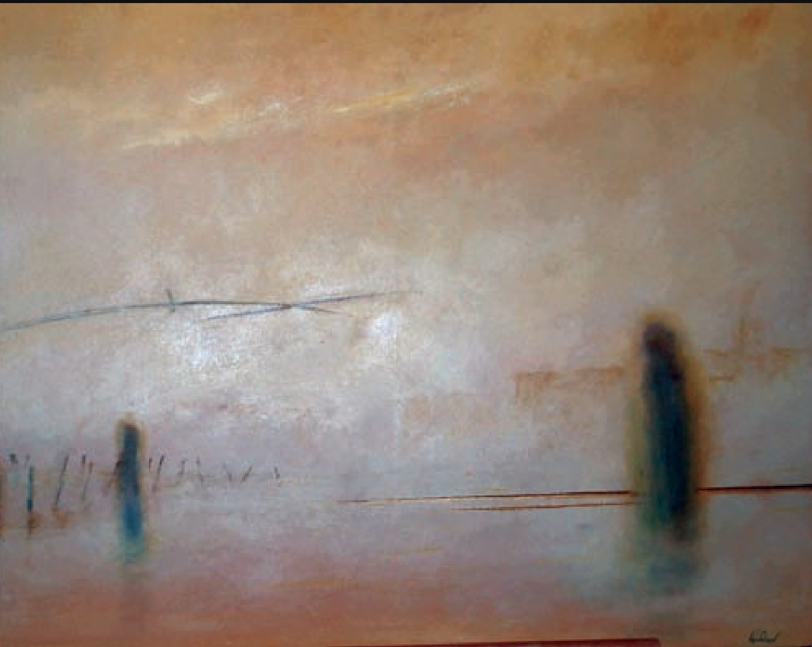
Escala d'aigua | Escalera de agua