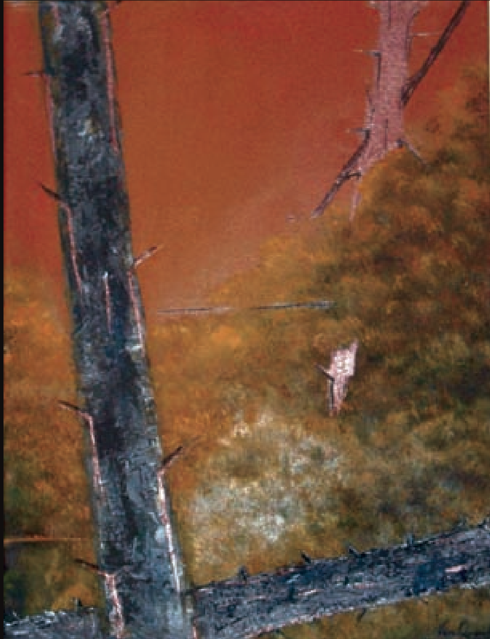
Et in arcadia ego I | Et in arcadia ego I