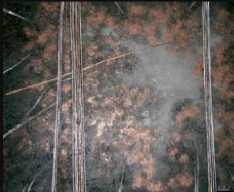
Sense suau sol | Sin suau sol