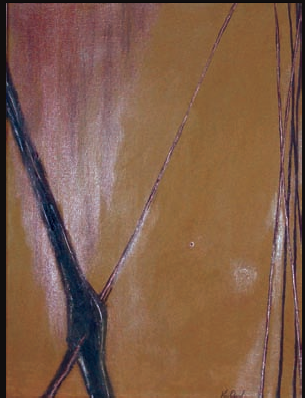
Et in arcadia ego IV | Et in arcadia ego IV