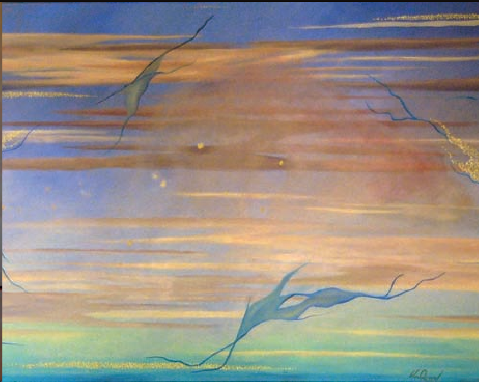
Les pinces del vuitè ésser | Las pinzas del octavo ser